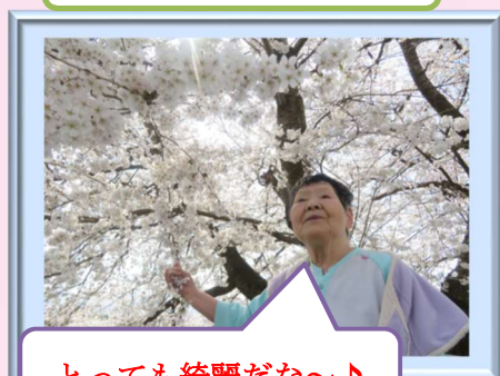
とっても綺麗だな～♪