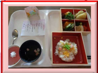
🌸 花見御膳 🌸