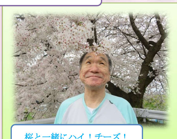
桜と一緒にハイ！チーズ！