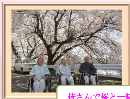
皆さんで桜と一緒に記念撮影しました♪